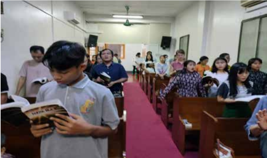
Myanmarin seurakuntalaisia messussa.